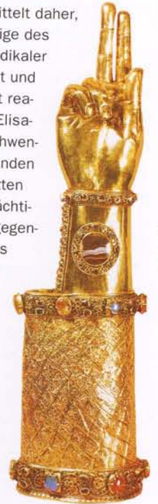
Bendorf-Sayn, Eigentum der fürstlichen Familie Sayn-Wittgenstein-Sayn