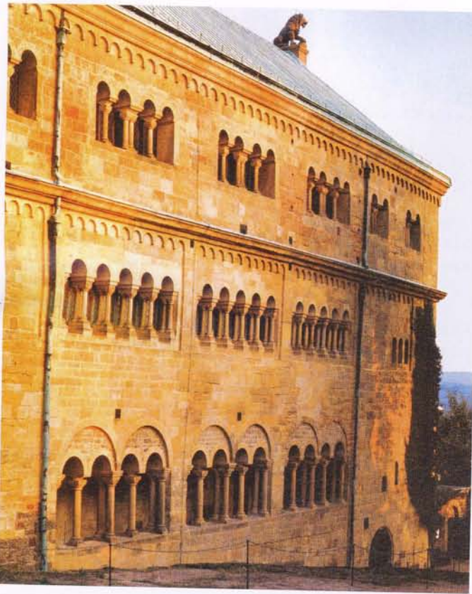
Elisabeth-Stätte: Der Palas, das Hauptgebäude der Wartburg, war für einige Jahre das Zuhause der ungarischen Prinzessin.

14 Jahren verheiratet und bald darauf Mutter dreier Kinder, wendet sich dem religiösen Armutsideal zu, das im frühen 13. Jahrhundert besonders von den Franziskanern propagiert wird. Sie spricht ihrem luxuriösen Leben ab, kümmert sich um Kranke und Aussätzige, besucht Armenviertel, lässt in einem Hungerjahr sogar sämtliche Kornvorräte verteilen und darbt selbst.