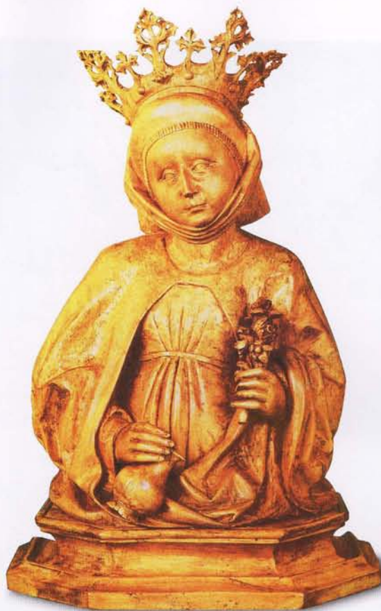
Elisabeth-Statue: Die Büste der Heiligen stammt aus dem 15. Jahrhundert und gehört heute zur Sammlung der Wartburg-Stiftung Eisenach.

ten. Sie war auch Wohnsitz Elisabeths, bis heute eine der populärsten Heiligen Europas: Schutzpatronin von Thüringen und Hessen, des Deutschen Ordens, der Witwen und Weisen, Kranken, unschuldig Verfolgten genauso wie der Bäcker und Spitzenklöpplerinnen und, und, und. Die dritte Thüringer Landesausstellung erinnert ab dem 7. Juli 2007 an die außergewöhnliche Adlige, die vor 800 Jahren geboren wurde. Auf der Wartburg werden Elisabeths extremer Lebensweg und ihre vielseitige Verehrung anschaulich gemacht. Neben einzigartigen Objekten, die aus aller Welt zusammengetragen werden, ist die Wartburg nicht nur musealer Rahmen für die Ausstellung, sondern selbst ein herausragendes Exponat – als wichtigster authentischer Lebensort der späteren Heiligen.