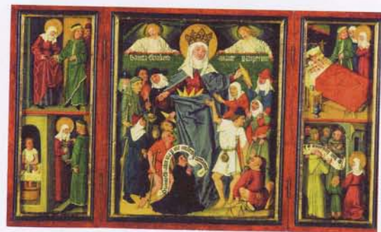
Staatliche Kunsthalle Karlsruhe

DIE AUSSTELLUNG DOKUMENTIERT den Prozess der Heiligspre- chung und die rasche Ausbreitung des Elisabeth-Kultes. Kostbare Altarbilder, Prachthandschriften, Textilien und Glasmalereien bei- spielsweise verdeutlichen die Dimensionen der Verehrung Elisa- beths. Zwei wichtige Beispiele der jüngeren Elisabeth-Rezeption birgt die Wartburg selbst: Die Elisabeth-Galerie mit Wandmale- reien Moritz von Schwinds und die prunkvollen Glasmosaiken der Elisabethkemenate sind bedeutende Erinnerungsstätten, die im 19. und 20. Jahrhundert zu Ehren dieser bemerkenswerten Frau geschaffen wurden. ■